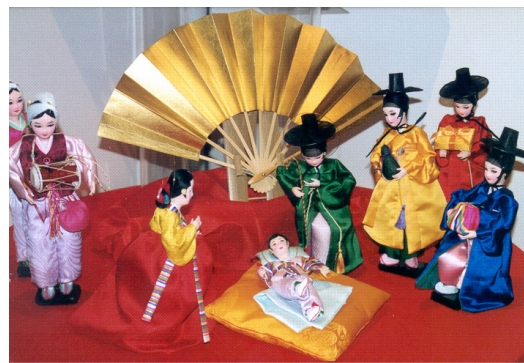
Krippe aus Korea

schließt sich hier mit einer weiteren Ausstellung im Saal des Gemeindezentrums an. Zur Eröffnung der Ausstellung am 1. November 2007 (Allerheiligen) um 15 Uhr im Rahmen eines Gottesdienstes mit musikalischem Programm in der Philipp-Melanchthon-Kirche sind Sie herzlich eingeladen. Die Kirche liegt in dem selben Gebäude, in dem sich der Ausstellungssaal befindet.