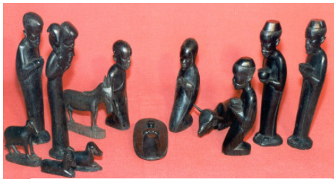
Krippe aus Ostafrika (Makondeschnitzerei)

auch auf die unterschiedlichen Materialien, die verwendet werden.